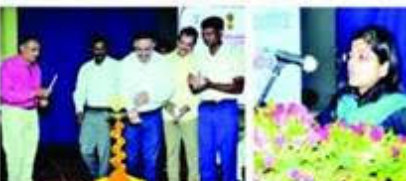
संघप्रदेश स्तरीय कौशल विकास मिशन के तहत ओपन हाउस में भाग ले रहे हैं।